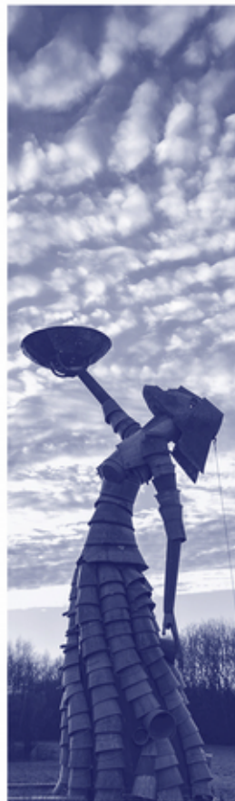
La Statua della Spoliazione